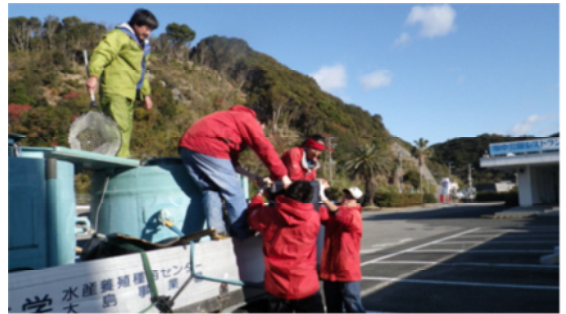
図 1. トラックから水槽までの搬入飼育経過

れて同じ方向に泳ぎ始めた。一度に運べる数の限界である 7 匹が入った時点で海上班はトラックが待機する港に向かい、トラック後部の運送用丸水槽に素早く移し水族館に向けて出発した。到着すると担架に海水と共に 1 匹ずつ丁寧に入れ、迅速にトンネル水槽まで運び、頭からそっと水槽に入れるという作業を行った（図 1）。生け簀からトンネル水槽までの所要時間は 60 分程であった。これらの作業手順をもう一度繰り返し、無事搬入された 13 匹（1 匹が船からトラックまでに死亡）は多少の擦れによる傷があるものの状態は良く、すぐに群れを作り元気に泳ぎ始めた。懸念されていた肉食魚の搬入個体への攻撃は大型クロマグロが少し反応する程度で捕食は起こらなかった。